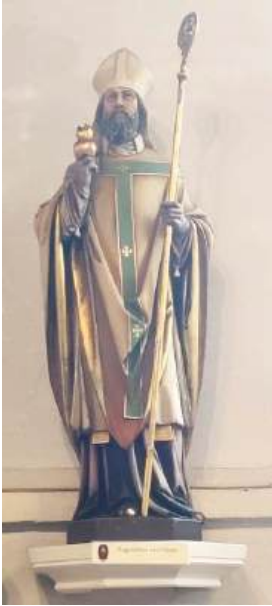
Museum Kranenburg- Vorden, foto: Pieter Renkens ←