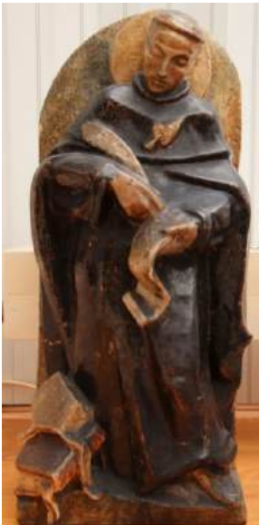
Augustinus in de kerk in Vianen is van de website van de genoemde kerk.