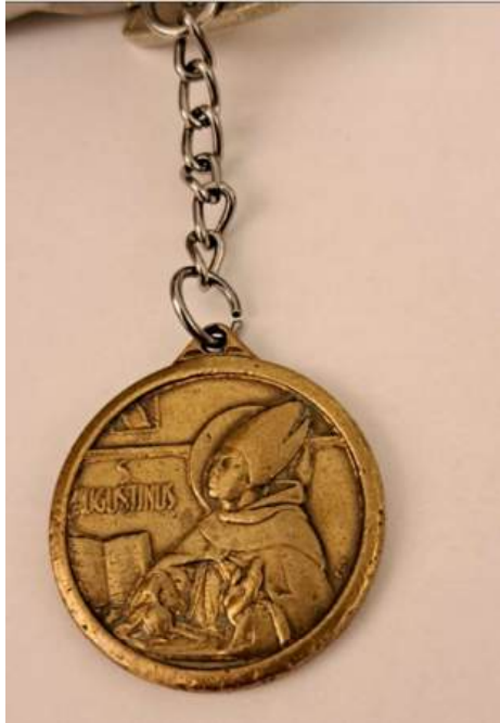
Sleutelhanger met H. Augustinus op de voorkant, generalaat Rome