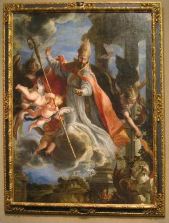
Triunfo de San Augustin Claudio Coello