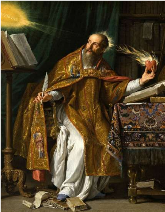
Afb.: Augustinus, olieverf op doek, ca 1645, Philippe de Champaigne, Los Angeles County Museum of Art