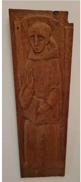
Houten paneel van Pierre de Grauw in het conferentiecentrum Samaya, de vroegere priorij Gods Werkhof