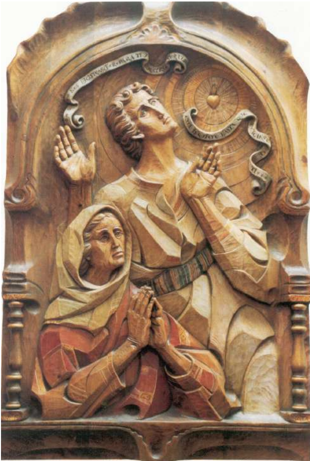
Augustinus en Monnica, houtsnijwerk