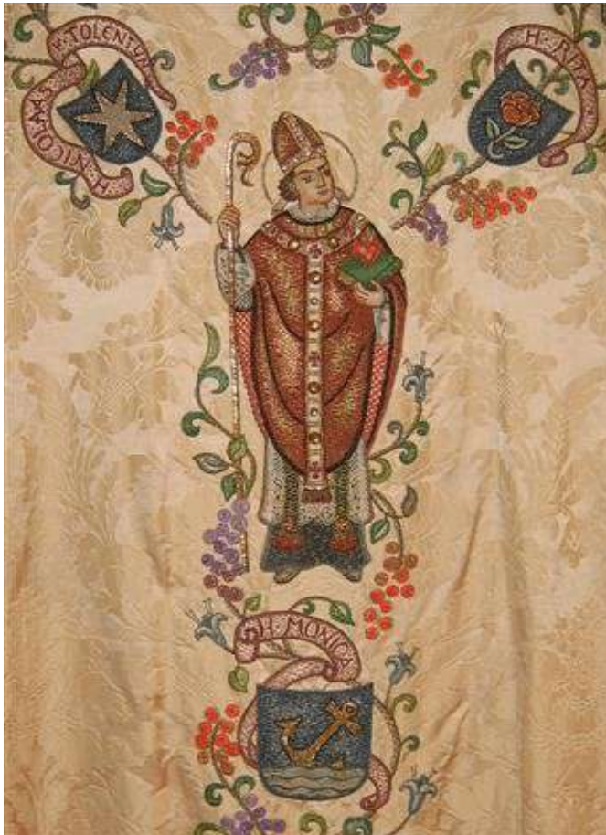
Kazuifel uit de tentoonstelling 100 jaar Paterskerk