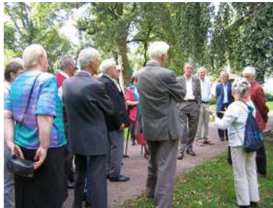
Uitleg over het ontstaan van het Valkhof

Na een mooie viering gingen we naar het Valkhofmuseum naar de iconententoonstelling, naar de bossen, of bleven we op de Boskapel