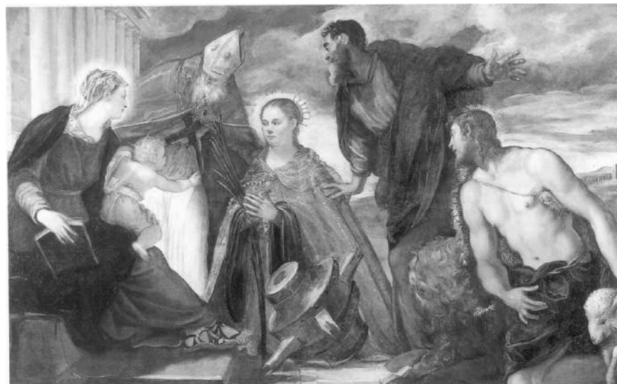
H. Maagd met kindje Jezus, H. Catharina, H. Augustinus, H. Marcus en H. Johannes de Doper

Studiedagen Augustijns Instituut Eindhoven Websites Augustijnen Vieringen Augustijnse agenda