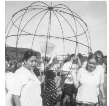
AJT 1998 Munnerstadt

Vooruitlopend op de World Youth Days, heeft de Duitse OSA besloten de jongeren uit te nodigen om zich in Duitsland in Weiden voor te bereiden op deze dagen, om daarna gezamenlijk deel te nemen aan de WYD 2005 in Keulen. De voertaal tijdens deze voorbereidingsdagen is Engels. Hieronder volgt de tekst van de uitnodiging. Voor vragen kun je altijd bij mij terecht, of je kunt rechtstreeks contact opnemen met Jurgen Hess in Duitsland.