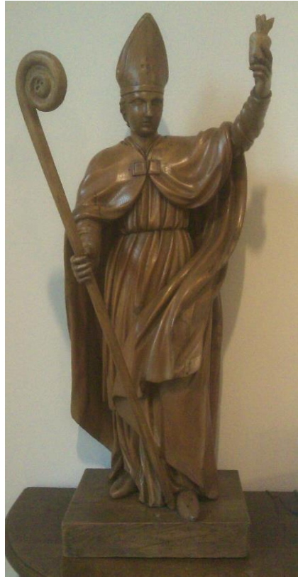
Augustinus in het klooster van de Kruisheren in St Agatha 800-jarig bestaan Kruisheren in september