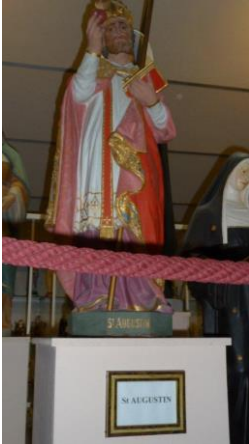
Augustinus in de beeldenfabriek in Lourdes