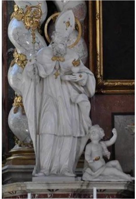
Augustinus in de kerk van de Augustiner Chorherrenstift, Brixen/Bressanone, Italië