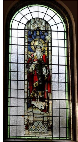
rechts: Augustinus, glas in lood Boarbank