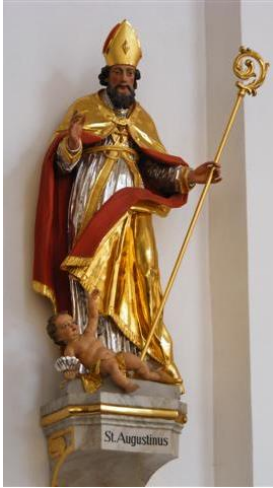
Links: Augustinusbeeld in de Jezuïtenkerk in Heidelberg.