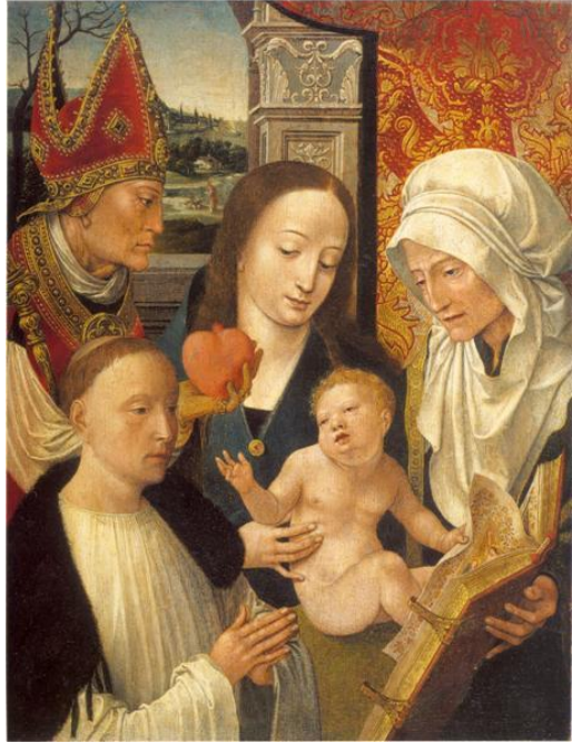
Sint Augustinus T.J.van Bavel, pag 135