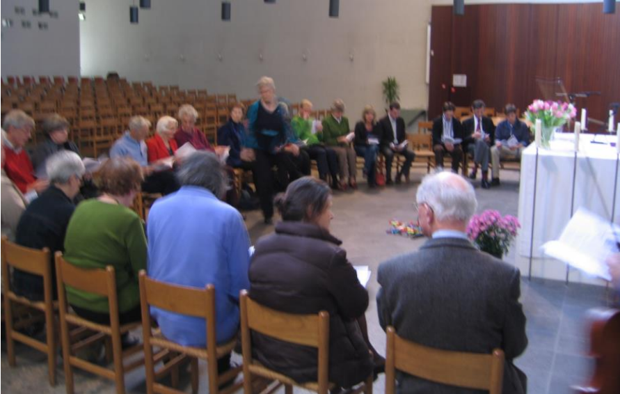
Viering in de Boskapel