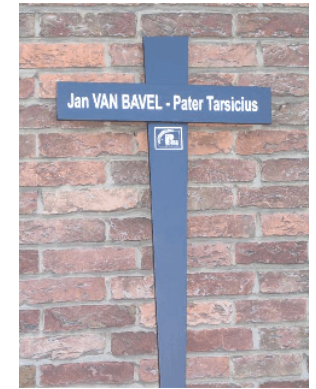
Naamkruis bij de kerkmuur