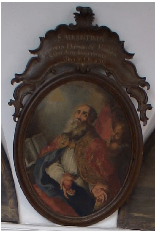
Augustinus, Franziskanerkirche, Lienz, Weissensee, Oostenrijk