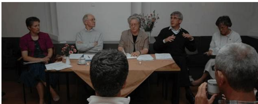
Het bestuur