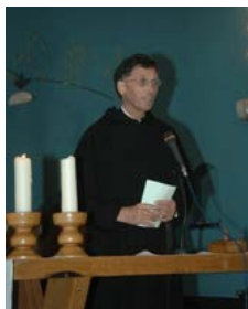
De nieuwe provinciaal