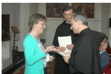
De statuten van de FAN