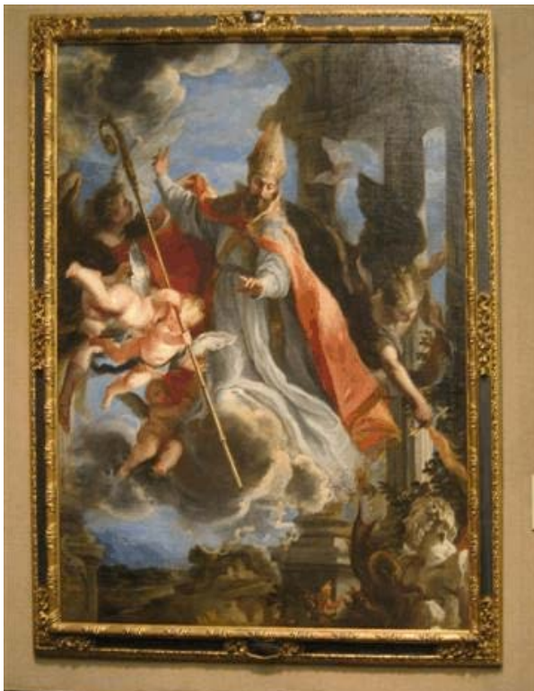
St Augustinus (Coelo - Prado, Madrid)