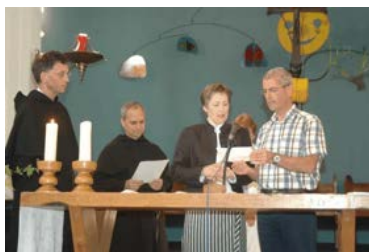
Uitspreken naar de orde